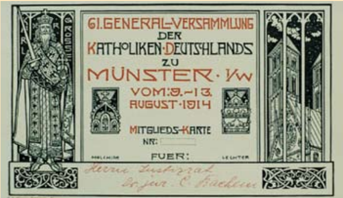
Die Mitgliedskarten waren schon gedruckt, aber der Ausbruch des Ersten Weltkriegs verhinderte den Katholikentag 1914 in Münster.

Schon seit 1837 hatte sich eine katholische Bewegung gegen Behördenwillkür und staatliche Reglementierung der Kirche zu sammeln begonnen, 1848 trat sie mit dem „Piusverein für religiöse Freiheit“ an die Öffentlichkeit. Bald gab es hunderte von ähnlichen Gründungen an vielen Orten. Vom 3. bis 6. Oktober 1848 trafen sie sich zu einer Generalversammlung, zum ersten Katholikentag. Schon bald entstand der Gedanke, für diese jährlich stattfindende Veranstaltung ein „geschäftsführendes Zentralkomitee“ einzurichten. Es sollte „perpetuierlicher Mittelpunkt für das Vereinswesen“ sein, 1868 wurde es erstmals gewählt. Zu seinen Aufgaben zählten die Vorbereitung der Generalversammlungen, die Sorge für die Ausführung ihrer Beschlüsse und die Förderung des katholischen Vereinslebens „sowohl durch häufige Kundgebungen in der Presse als auch durch persönlichen Verkehr“. Das Engagement galt drängenden Fragen in Kirche und Gesellschaft, wie Diaspora und Mission, Caritas, Wissenschaft, Wirtschaft, Publizistik, Bildung und soziale Gerechtigkeit.