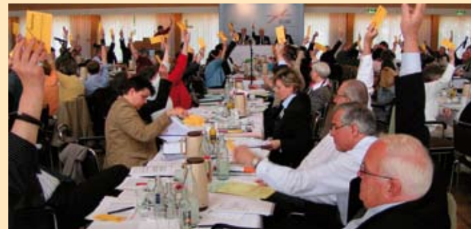
Die Vollversammlung gibt die Richtlinien der ZdK-Arbeit vor.

Als Laien bezeichnet man alle Mitglieder der katholischen Kirche, die nicht zum Diakon, Priester oder Bischof geweiht sind. Seit dem II. Vatikanischen Konzil (1962-1965) gibt es eine im Verständnis der katholischen Kirche neue Sicht und Bewertung der Laien. Die Kirche würdigt die Gemeinschaft aller Gläubigen, unter denen kraft der Taufe eine wahre Gleichheit besteht. Alle – Laien und Kleriker – sind zur Ausübung der Sendung berufen, die Gott der Kirche zur Erfüllung in der Welt anvertraut hat.