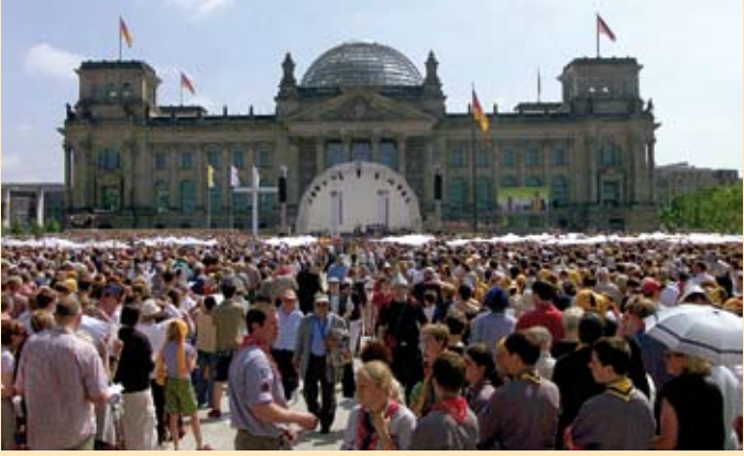
Abschlussgottesdienst, ÖKT Berlin 2003