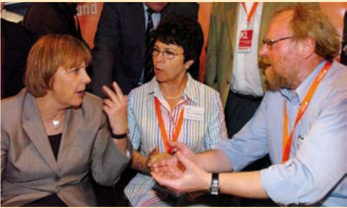
Angela Merkel, Rita Waschbüsch und Wolfgang Thierse beim Katholikentag

Gemeinsam mit dem jeweils gastgebenden Bistum veranstaltet das ZdK alle zwei Jahre den Deutschen Katholikentag und arbeitet an der stetigen Weiterentwicklung dieser großen Laientreffen. Sie gehören zum Ursprung der katholischen Laienbewegung und bilden auch heute einen wichtigen Schwerpunkt in der Arbeit des Zentralkomitees. Zeitlich und räumlich konzentriert sind sie ein Spiegel dessen, was die katholische Laienbewegung und das ZdK ausmacht.